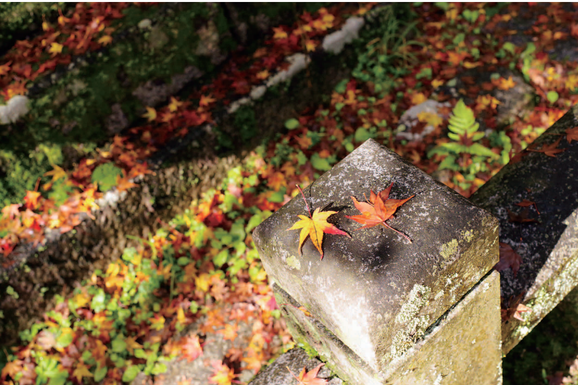
西山寺興隆寺の境内にて